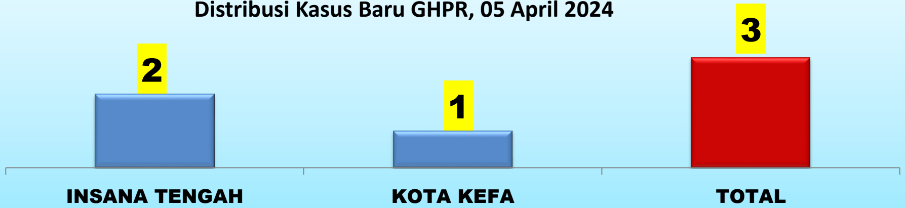
Distribusi Kasus Baru GHPR, 05 April 2024