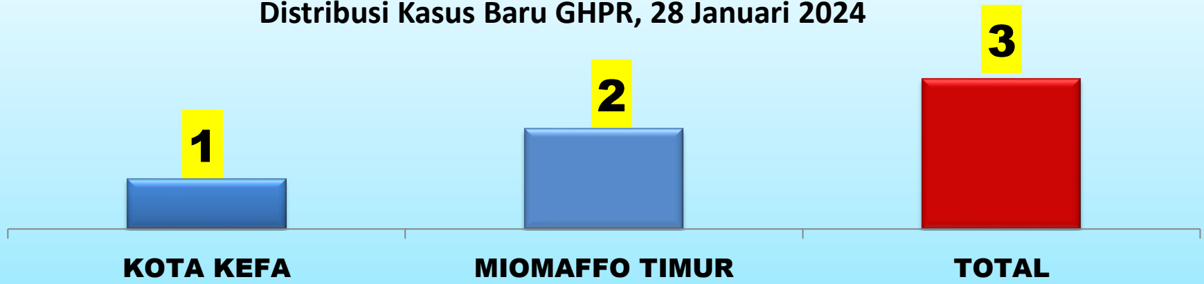
Distribusi Kasus Baru GHPR, 28 Januari 2024