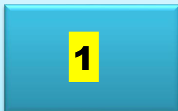
Distribusi Kasus Baru GHPR, 06 Januari 2024