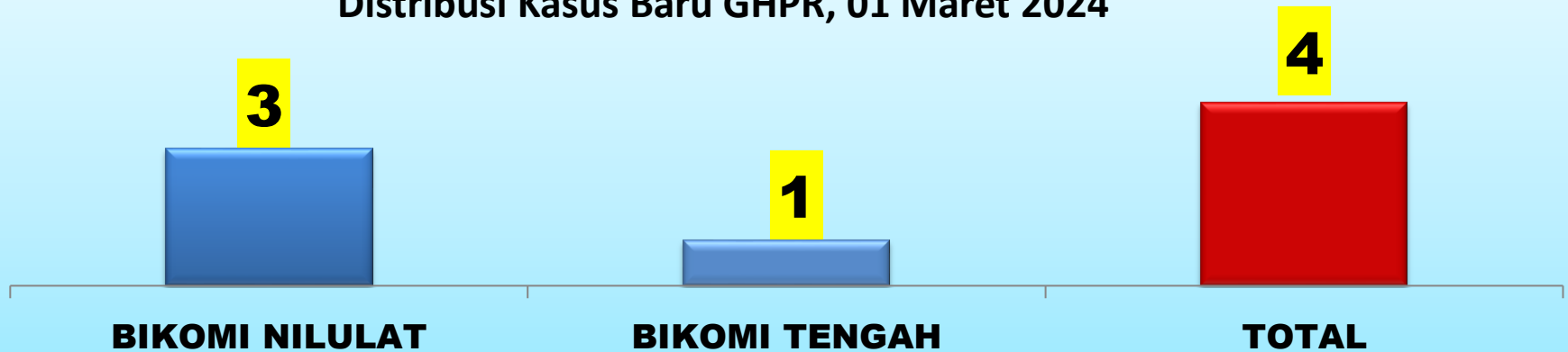
Distribusi Kasus Baru GHPR, 01 Maret 2024