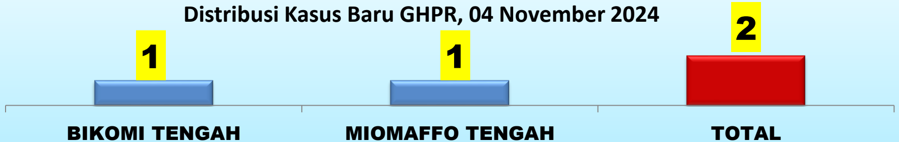
Distribusi Kasus Baru GHPR, 04 November 2024