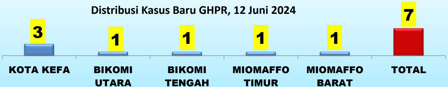
Distribusi Kasus Baru GHPR, 12 Juni 2024