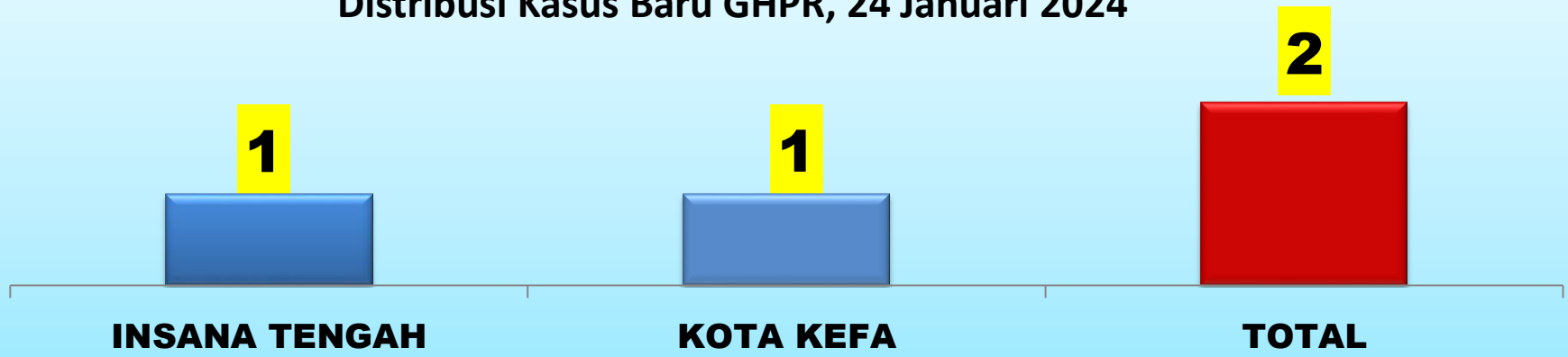
Distribusi Kasus Baru GHPR, 24 Januari 2024